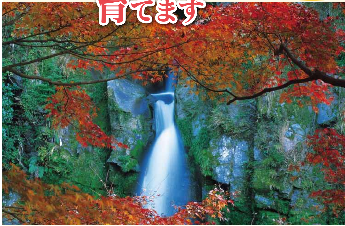
観音滝(さつま町)