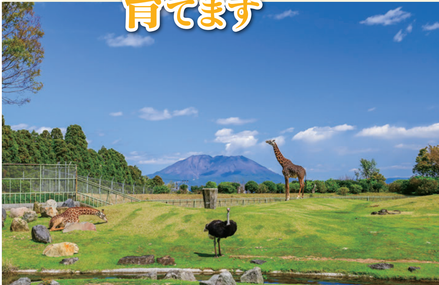
平川動物公園（鹿児島市）