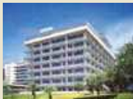
総合臨床研修センター